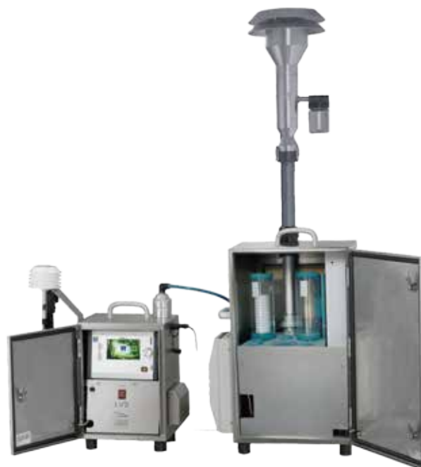
* 若图片与实物不符，则以实物为准