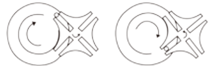
马耳他十字机芯传动机理

全新滤膜同步更换技术(专利号: 2015110108375)使得滤膜转换的路径更短, 单电机驱动, 使故障率降到最低, 确保30万次换膜连续无故障运行。