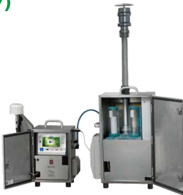
* 若图片与实物不符，则以实物为准