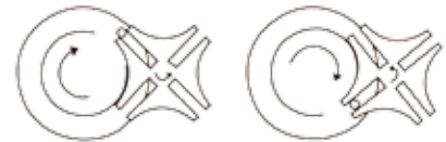
马耳他十字机芯传动机理

全新滤膜同步更换技术(专利号: 2015110108375)使得滤膜转换的路径更短, 单电机驱动, 使故障率降到最低, 确保30万次换膜连续无故障运行。