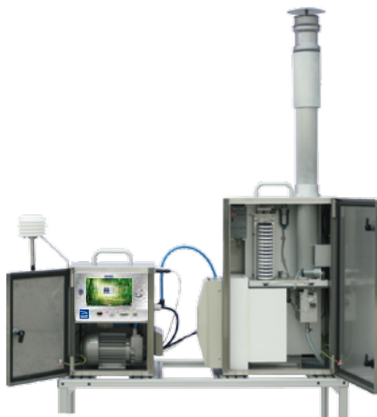
* 若图片与实物不符，则以实物为准