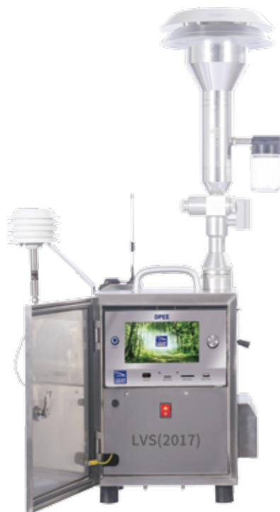
* 若图片与实物不符，则以实物为准