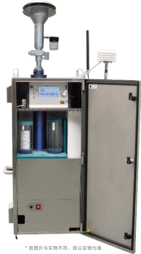
* 若图片与实物不符，则以实物为准