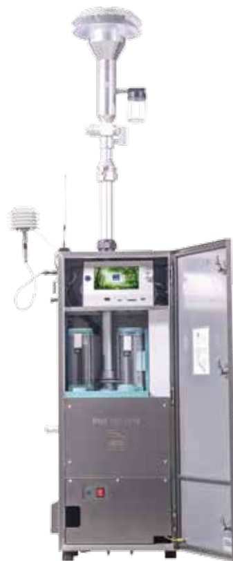
* 若图片与实物不符，则以实物为准