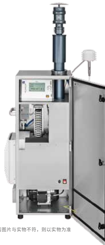
* 若图片与实物不符，则以实物为准