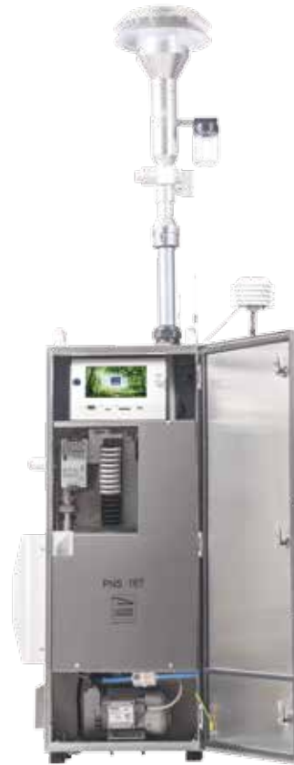
* 若图片与实物不符，则以实物为准